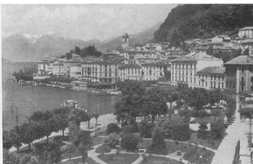
Bellagio (Lago di Como)