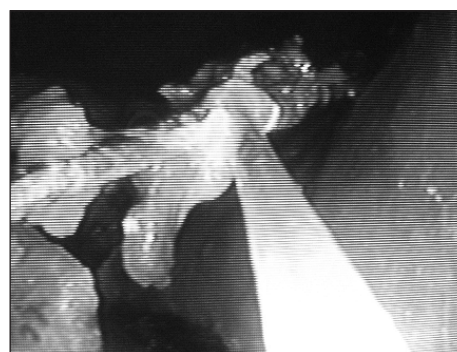
Fig. 2. Endoscopic view of the teaspoon (covered with food particles) grasped by a polypectomy snare at the edge of the handle.

From the Emergency Department, Meyer Children's Hospital, Rambam Medical Center, Haifa, Israel